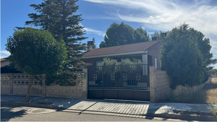
PUERTA A ENTRADA