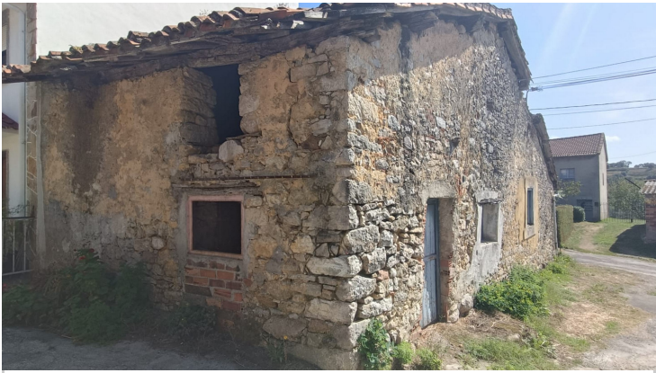
PART E TRASERA DE LA CASA