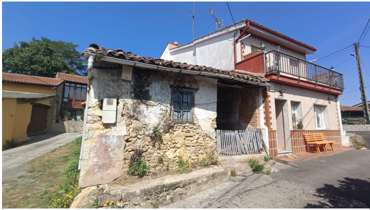
CASA DE PIEDRA A REFORMAR