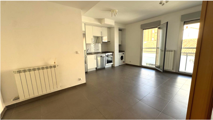
SALON COCINA 1