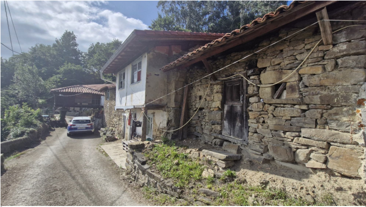
CASA Y CUADRAS