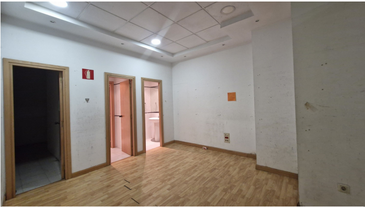
ALMACÉN O DESPACHO