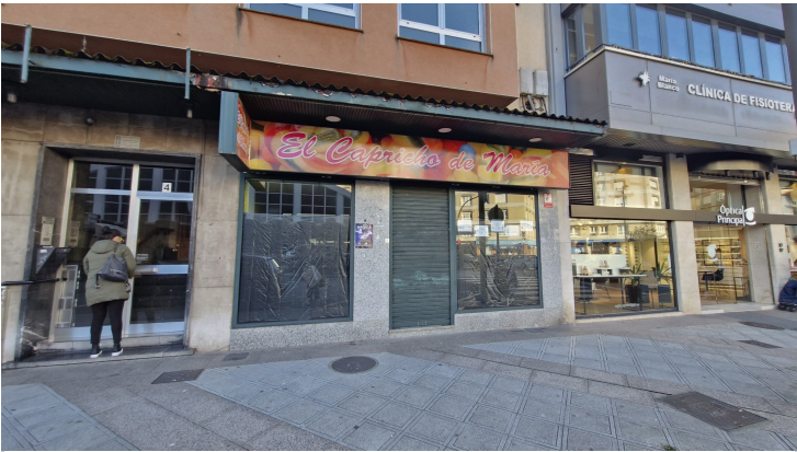
FACHADA EN CALLE ALCALDE PARRONDO